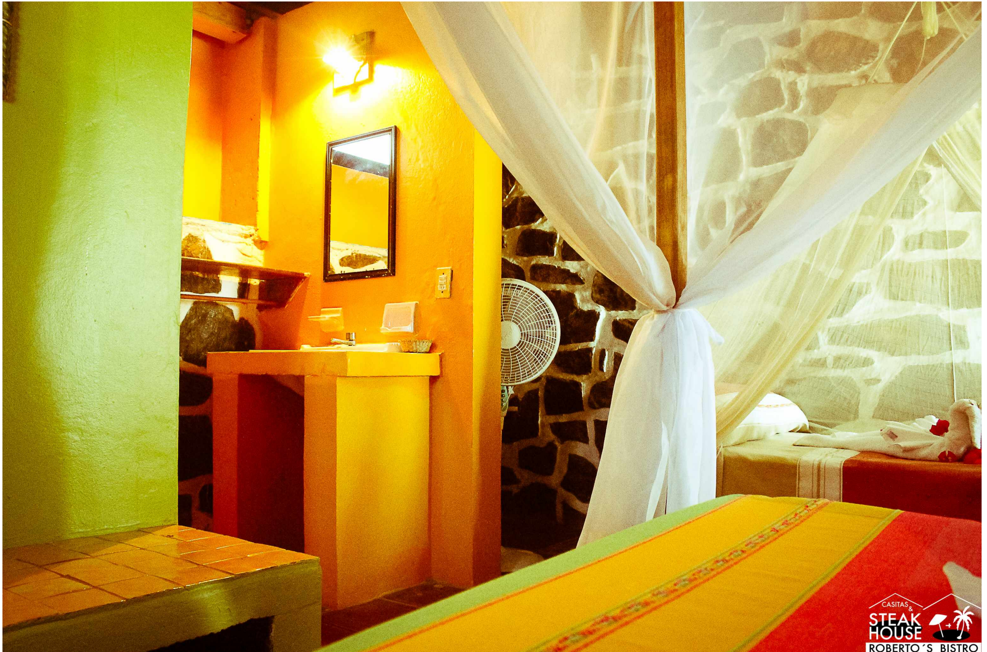
Baño propio, regadera con agua caliente, ventilador de techo y piso